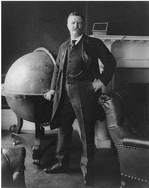
Theodore (Teddy) Roosevelt