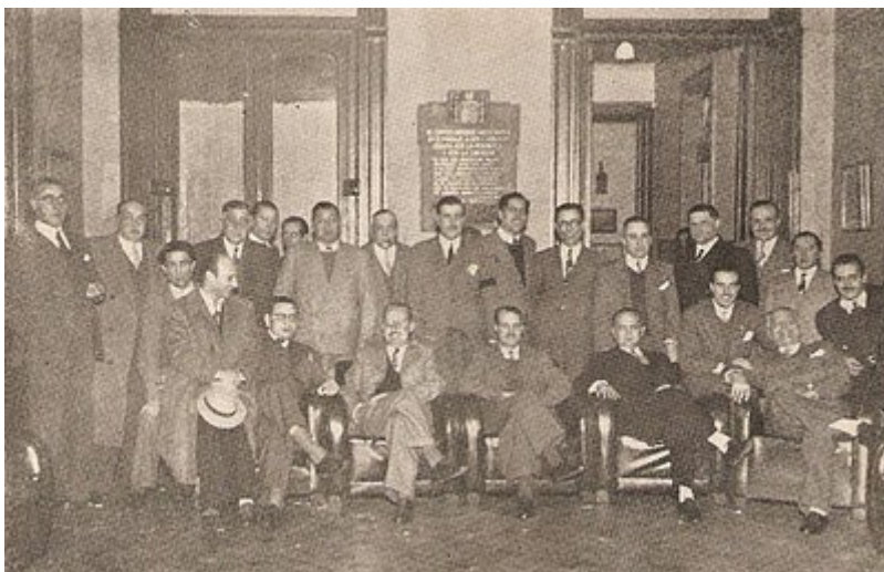
La Logia Tolerancia (G.º. O.º. F.º. A.º.). Verbum.