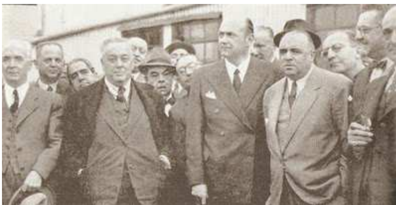
Autoridades del G.: O.: F.: A.: (Gran Oriente Federal Argentino, 1935-1956), con el Hermano Diego Martínez Barrio, presidente de la República Española en el exilio.