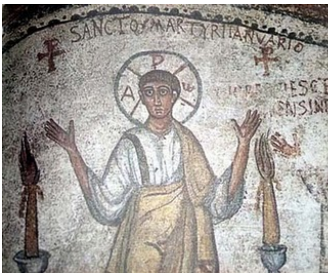
Ambrosio, Obispo de Milán.

"En un sistema religioso tradicional, la imaginería y los rituales a través de los cuales esa imaginería se integra en la vida de una persona, son presentados de modo autoritario por los padres o los evangelizadores, y se espera que el individuo experimente los sentidos y los sentimientos buscados."