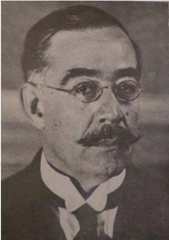
Leopoldo Lugones (1874-1938)