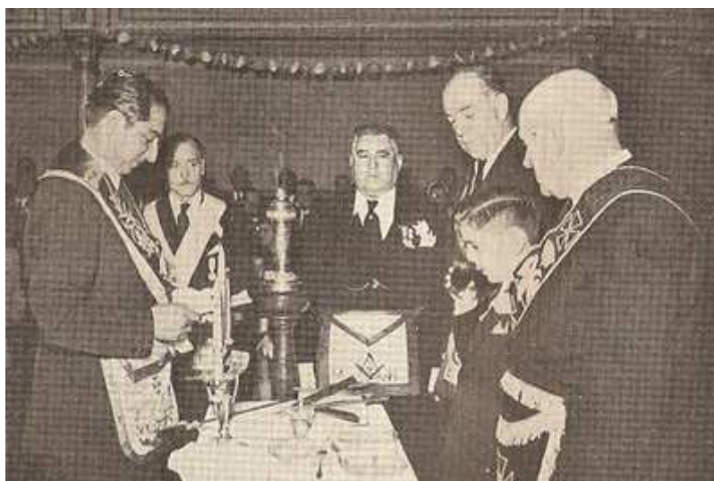
Ceremonia de adopción de Loweton, en la Logia Confraternidad Argentina N° 2 -Gran Logia de la Argentina-, 1954.