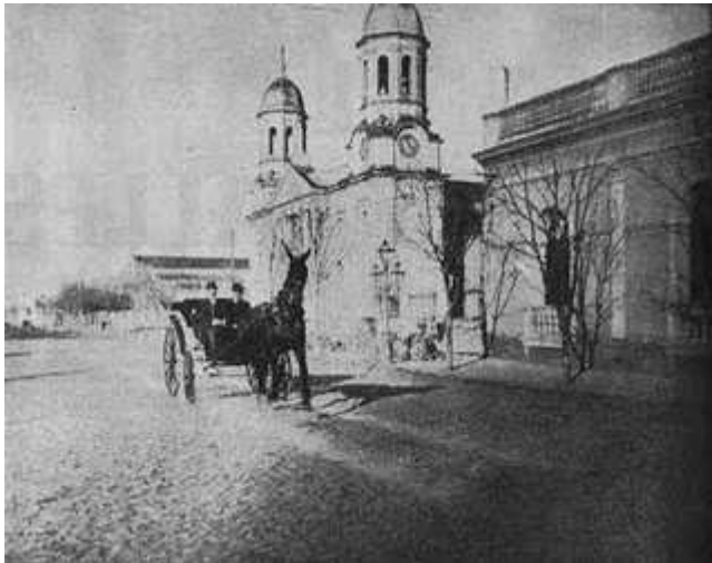
Imagen de la Iglesia primitiva donde se ven sólo dos torres y el delta en el centro. En pleno siglo XX se quitará el delta y se colocará una tercera torre en su lugar.