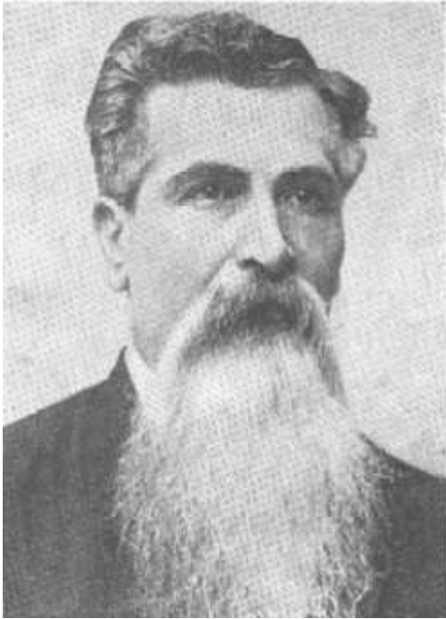
Leandro N. Alem (1842-1896)