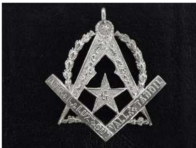
Medalla de la Logia Luz del Sud