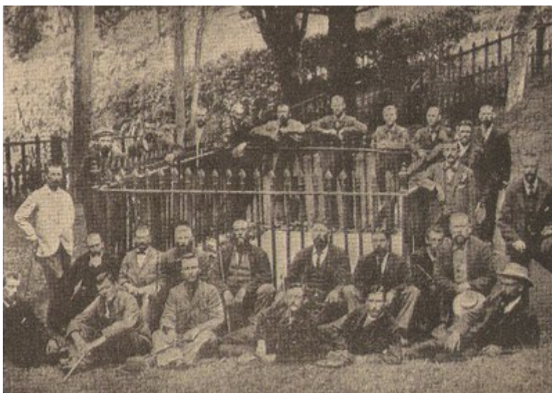
Grupo de masones, prisioneros de guerra de la contienda anglo-boer, reclusos por los ingleses en la isla de Santa Elena. Confraternizaron allí con los hh.º. y aquí aparecen rodeando la tumba de Napoleón en un acto de confraternidad que demuestra como la Fraternidad vence a la guerra. Verbum. Archivos del G.º. O.º. F.º. A.º.